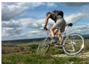
VTT (1)